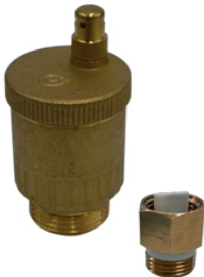
PURGA AUT. FLOATVENT HE 1"