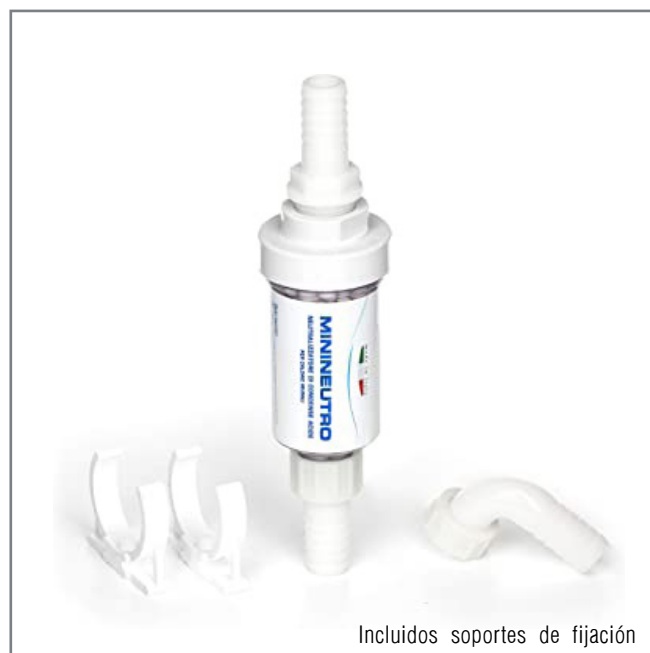
Incluidos soportes de fijación